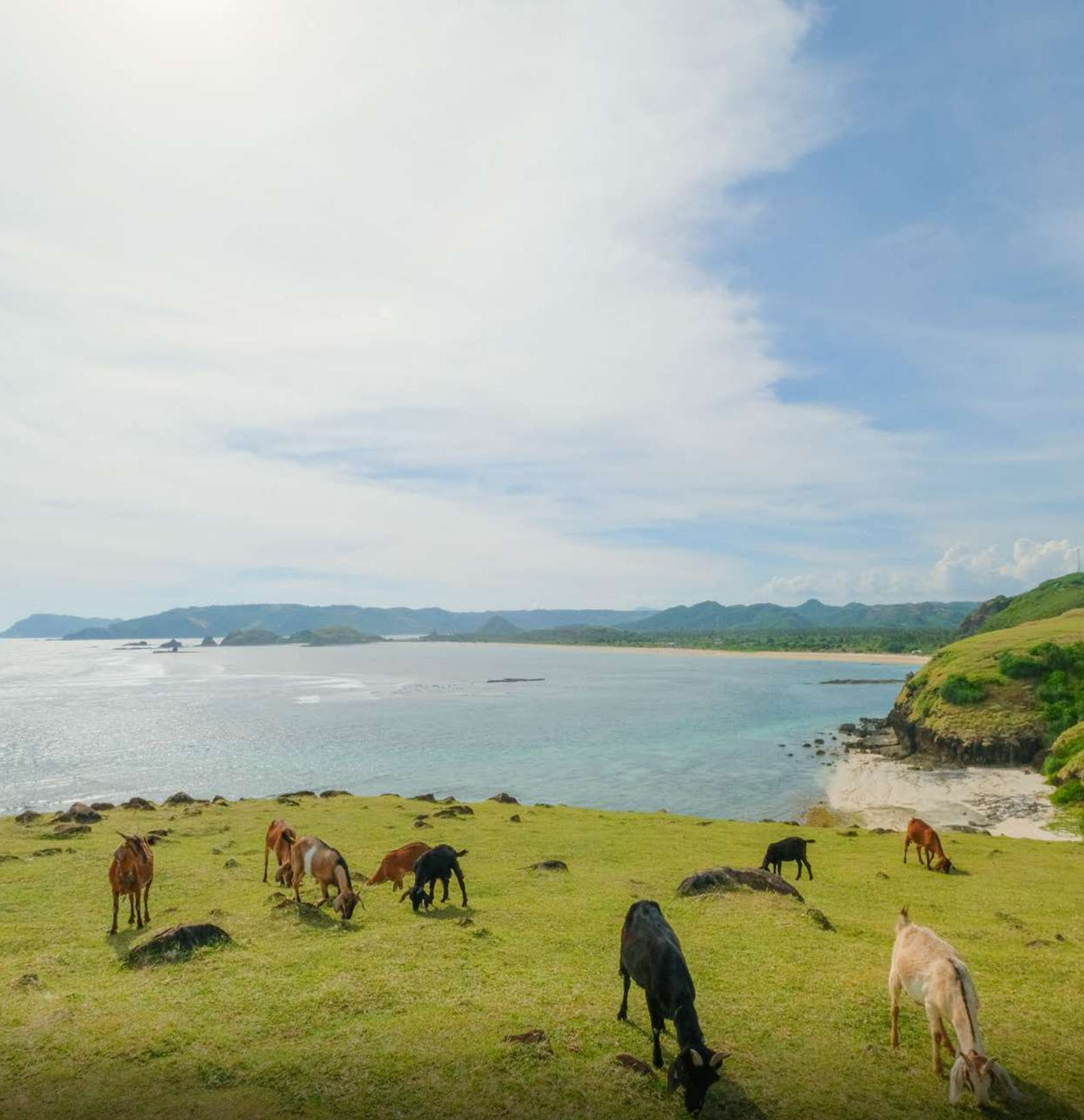
Bukit Merese, The Mandalika